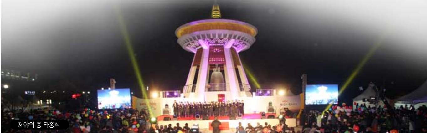
제야의 종 타종식