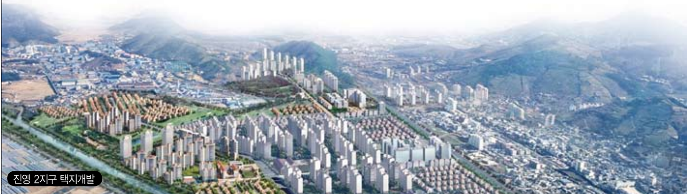
진영 2지구 택지개발