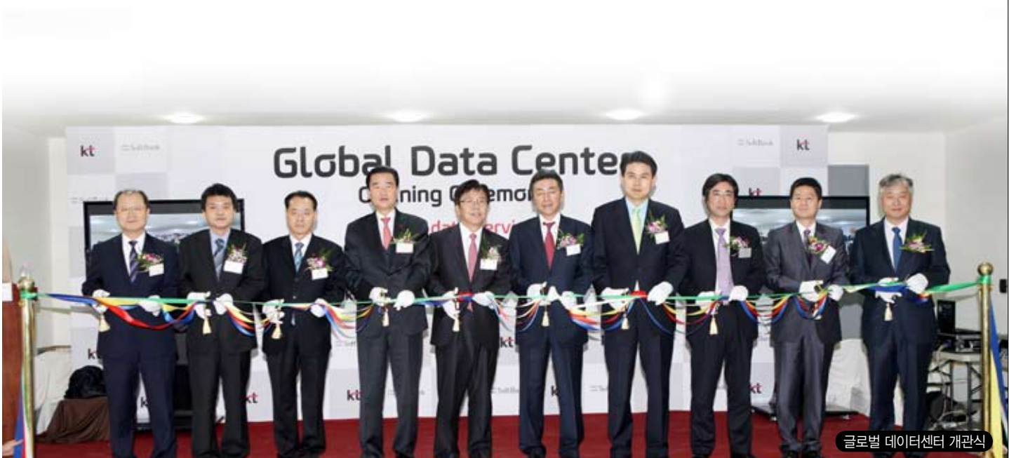
글로벌 데이터센터 개관식